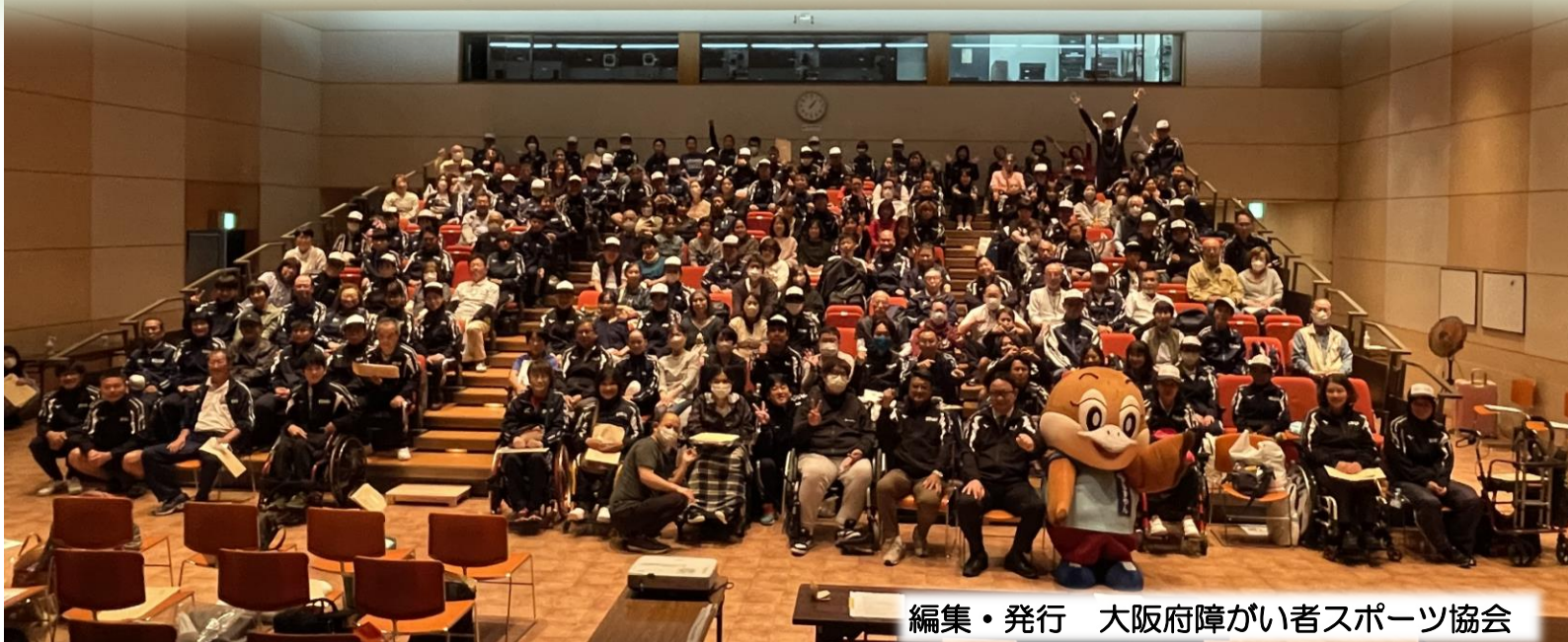
編集・発行 大阪府障がい者スポーツ協会