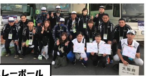
バレーボール (精神)