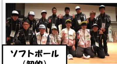
ソフトボール (知的)